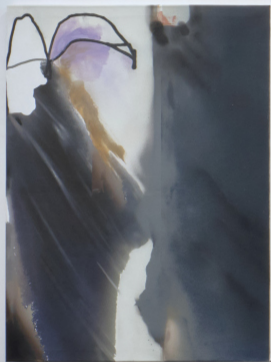
Resurfacer, 2023 Susanne Schwieter Acryl-, Ölfarbe, Gesso und Chrome Pigment Druck auf Leinwand 90 x 120 cm 3000.00 CHF