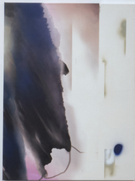
Protector, 2023 Susanne Schwieter Acryl-, Ölfarbe, Gesso und Chrome Pigment Druck auf Leinwand 90 x 120 cm, 3000.00 CHF