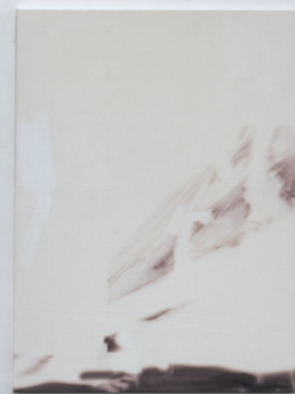
Veins ( 2 ), 2023 Susanne Schwieter UV- Druck, Ölfarbe und Gesso auf Leinwand 90.x 120 cm, 3000.00 CHF