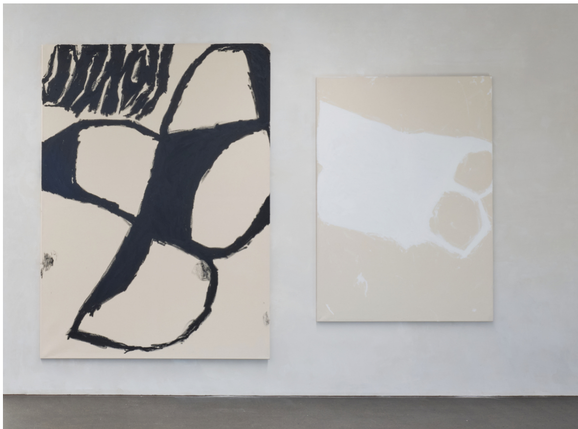
Friday Studio Lines, 2023 Gabriele Herzog Ölkreide und Gesso auf Rohbaumwolleinwand 130 x 185 cm, 7000.00 CHF