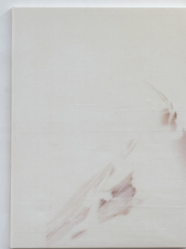
Veins ( 1 ), 2023 Susanne Schwieter UV- Druck und Gesso auf Leinwand, unique 90 x 120 cm, 3000.00 CHF